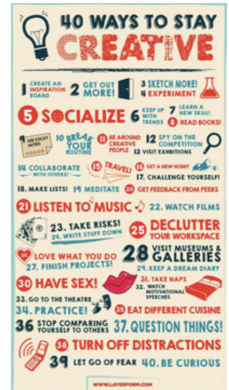
Illustration outil :