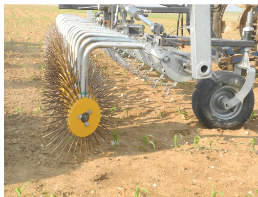
Modèles de roto-étrille